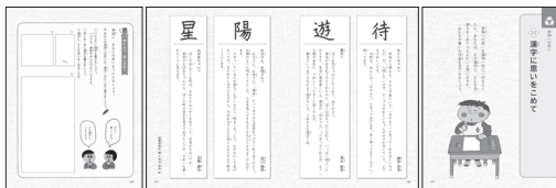
●「どうとく3 きみが いちばん ひかるとき」(光村図書)

今後、「大切な人へ漢字を贈る」ということが、私たちにとってより身近な習慣になる日も近いかもしれません。