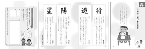
●「どうとく3 きみが いちばん ひかるとき」(光村図書)

今後、「大切な人へ漢字を贈る」ということが、 私たちにとってより身近な習慣になる日も 近いかもしれません。