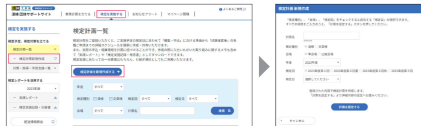
▲計画名(任意)を入力し、 該当の検定日を設定する

「検定を実施する」>「検定計画新規作成」 または「検定計画を新規作成する」 ボタンから検定計画を作成する