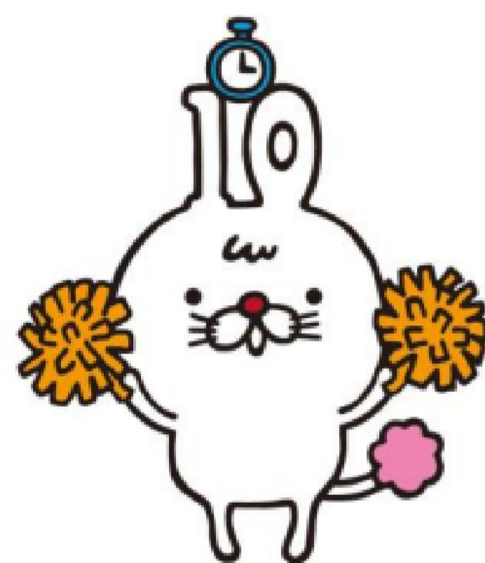
「いちまる」イラスト:kaorimix