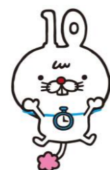
「いちまる」イラスト:kaorimix