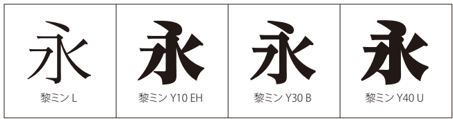
このほか、あと30書体の縦線と横線の太さがそれぞれ異なる黎ミンがある。