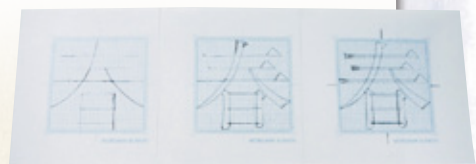
左から、字の骨格、ラフデッサン、清書。 紙を重ね、微調整しながら丁寧に描いていく。

それまで我が社にあった「リュウミン」という明朝体に対して新しい明朝体を、というので作った「黎明（れいめい）ミン」です。最初の構想だけで12年、完成までに15年かかりました。明朝体やゴシック体というのはその会社の顔になりますし、リュウミン同等の、いやそれ以上のものを作らないといけませんので、プレッシャーもありました。完成したときは、それは嬉しかったし、何よりホットしました。初めての挑戦でもありましたから、黎明（れいめい）ミンを手がけて良かったと感激しましたね。