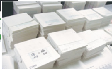
積み上げられたデッサンの束。 一文字一文字丁寧に手描きされている。

文字を作りたい」という方針を打ち出して作られる書体もあります。 コンセプトが決まると、デッサンを行います。60ミリ四方の紙に文字を手作業で描いていきますが、ここでは、コンセプトがぶれないように一人のデザイナーで基本となる500字を全て描きあげます。一つの書体で約二万字ありますが、この500字にはその一万字のほとんどの形状が含まれているのです。 そしてその字を元にして、複数のメンバーで残りの文字を一字ずつ描き上げます。それでも一万字全てのデッサンを終えるまでに1年から2年かかります。