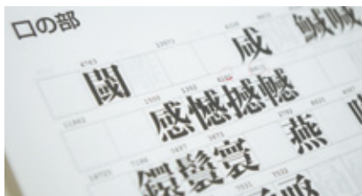
「口」という部品に分けられている漢字群。 「憾」「撼」「憾」は全て「感」を持つが、その幅やバランスは微妙に異なっている。

基本的には、ですけれどもね。同じ部品を持つ漢字でも、微妙に幅やバランスを変えて作成しています。その後、同じ形状を持つグループで分け、コンセプトイメージが揃っているかの確認も行っています。